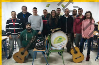
Chirigota Los que cargan con las madalenas