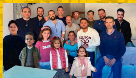
Chirigota Los Inmortales