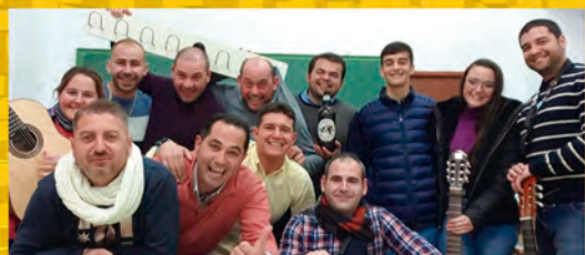
Chirigota Los Tiracañas